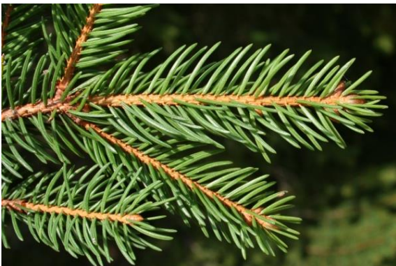
Fichte / Rottanne

Das es zwei verschiedene Tannen gibt, weißt du ja bereits. Weißt du auch, wie man die Weisstanne von der Fichte / Rottanne mit Hilfe ihrer Nadeln unterscheidet?