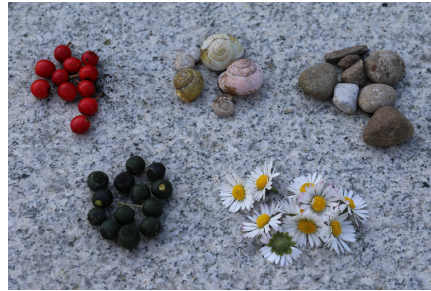
2. Sammle 48 Spielsteine (Schneckenhäuser, Blumen, Steine, Beeren)