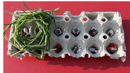
Du kannst dein Spiel in einer Eierschachtel aufbewahren.