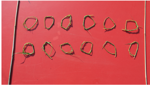
1. Spielfeld: Forme zwölf Ringe (z.B. aus Gras). Lege sie wie im Bild hin.