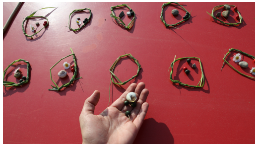
Wer beginnt leert einen beliebigen Ring auf seiner Seite und legt je ein Stein in die folgenden Ringe. Auch in die eigene Kalaha und die Ringe vom Gegner. Die Kalaha des Gegners lässt ihr aus.