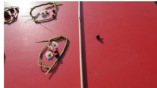
Fällt der letzte Stein in deine eigene Kalaha, darfst du nochmals ziehen.