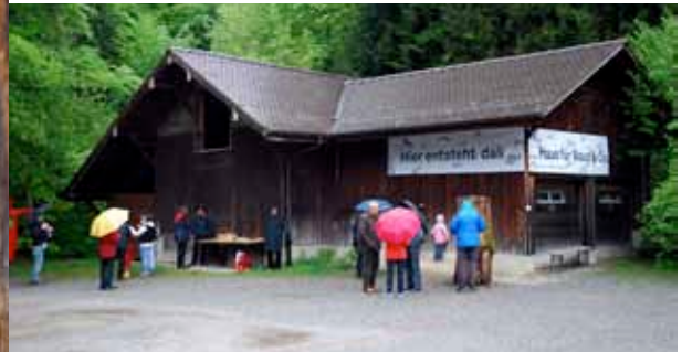
Wer wohnt denn da? – Im Herbst 2014 ziehen Hausmaus, Ratte und Siebenschläfer im Langenberg ein.

Das «Haus für Maus & Co.» kann im Langenberg gebaut werden. Innert zwei Jahren haben wir dafür rund 330 000 Franken gesammelt. Die Eröffnung des Müsli-Hüsli ist für den 4. und 5. Oktober 2014 geplant.